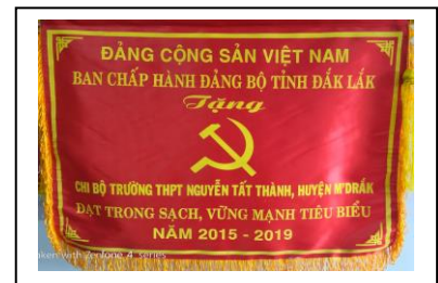
Cờ Chi bộ Trong sạch, vững mạnh, tiêu biểu năm 2015-2019