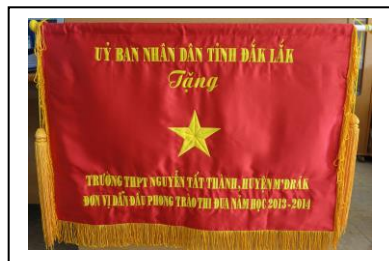
Cờ Thi đua của UBND Tỉnh Năm học 2013-2014