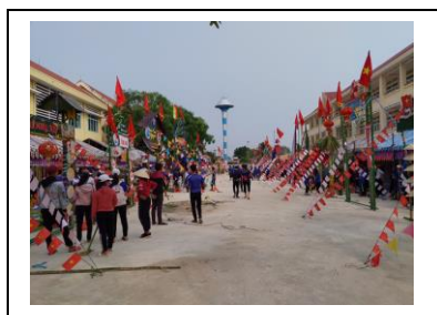
Hội trại “ Đoàn kết- Xung kích – Sáng tạo ” 26/3/2019