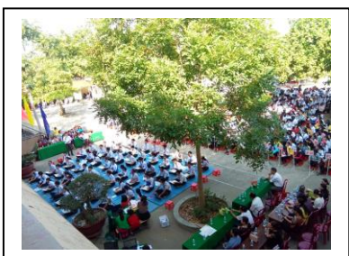
Sinh hoạt “ Đỉnh cao tri thức ” lần thứ 3