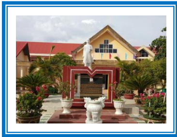
Tượng Danh nhân Nguyễn Tất Thành