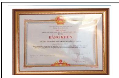
Bảng khen của Thủ tướng Chính phủ